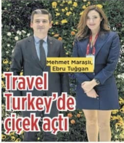
Hilca Hotel, 18. Travel Turkey Fuarı'nda çevre dostu standıyla öne çıktı. 20 bin