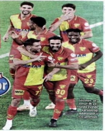
Geçen hafta yeni sarı siyah yanı sıra yanı sıra yanı sıra